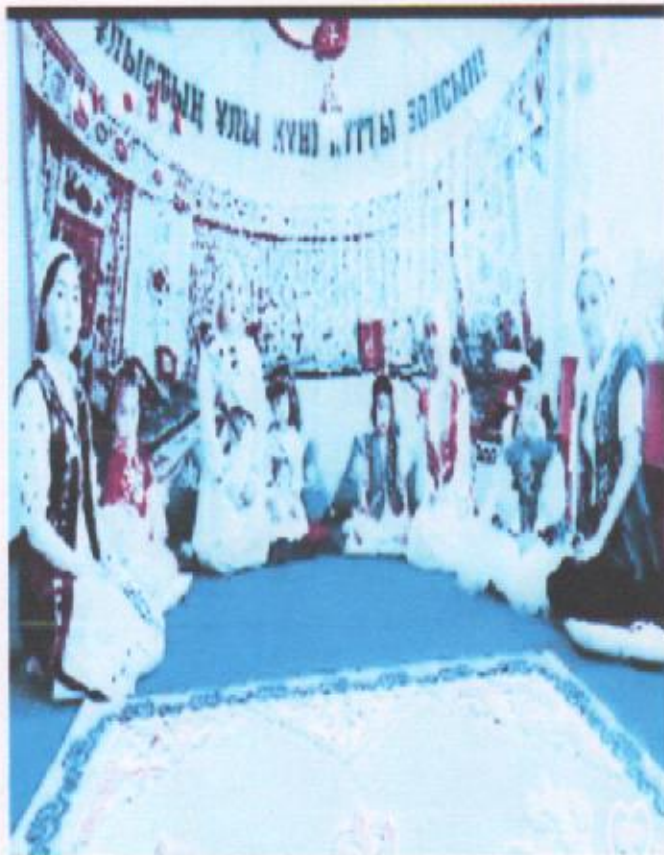
Тақырыбы: Аяулы анағару қыз байқауы